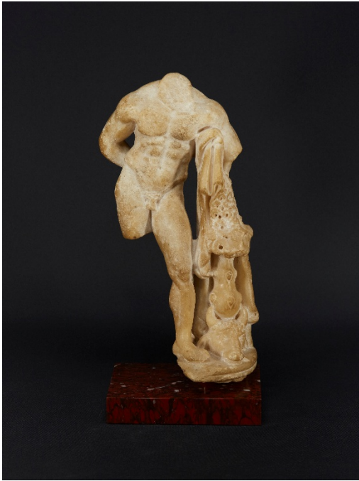
Herakles-Statuette Galerie Plektron Fine Arts, Zürich