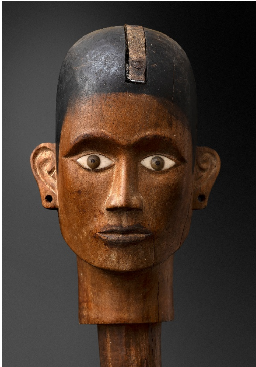
Kopf einer "Tau-Tau"-Figur Bigler Fine Arts, Zürich