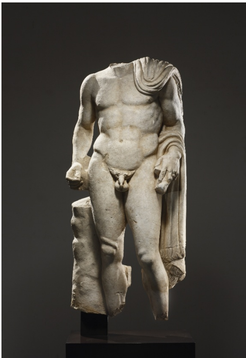
Marmorstatue Galerie Cahn, Basel

Alle Bilder in grosser Auflösung erhältlich unter www.antike-in-basel.com/de/downloads/