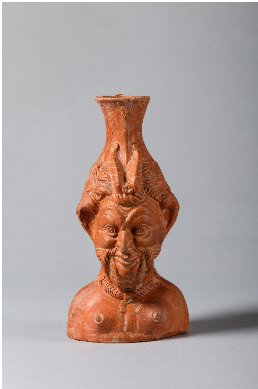
Weinkanne in Form einer Büste des Gottes Pan Galerie Jürgen Haering, Freiburg i.Br.