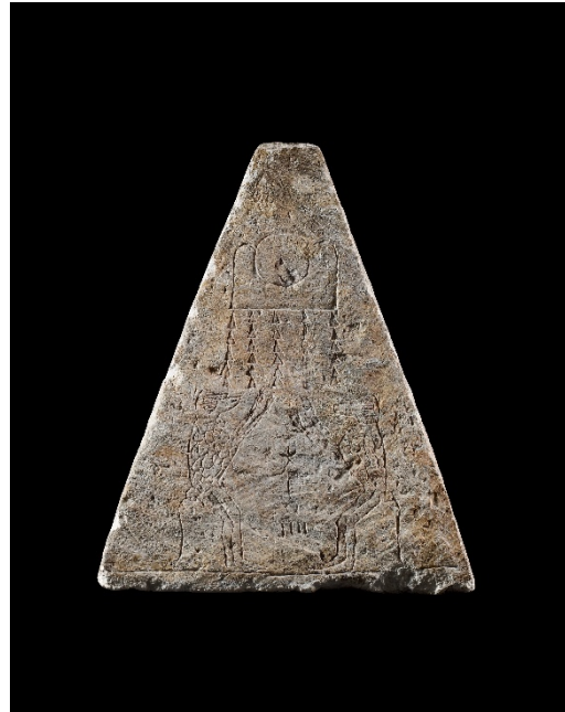
Pakharu Pyramidion Galerie Eberwein, Paris