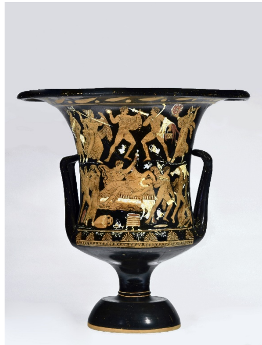
Grosser Kelchkrater Galerie Günter Puhze, Freiburg i.Br.